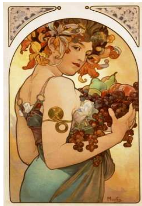
A búcsúzás képe